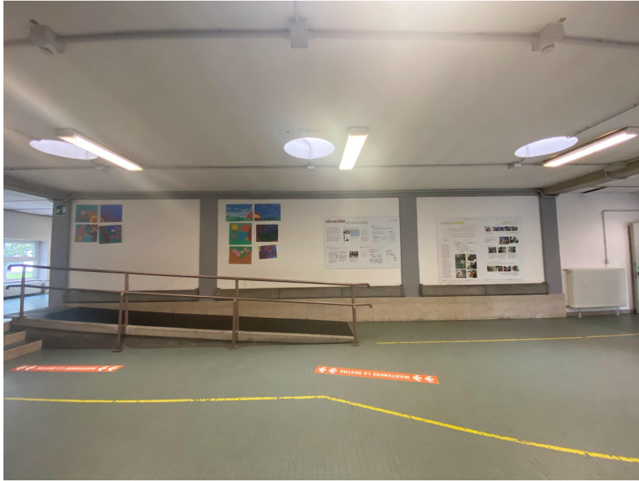
Parete dove realizzare il murales.

E' iniziata la realizzazione del progetto " Murales " in sinergia tra gli studenti di seconda e terza del nostro Istituto e gli studenti di quarta e quinta superiore del Liceo Artistico Chierici indirizzo figurativo nell'ambito dei percorsi per le Competenze Trasversali e per l'Orientamento (PCTO).